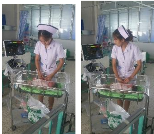
รูปภาพกิจกรรมการจับ O 2 Sat ในทารกแรกเกิด อายุมากกว่า 24 ชม.